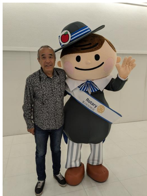
◆ ロータくと築館ガバナー ◆