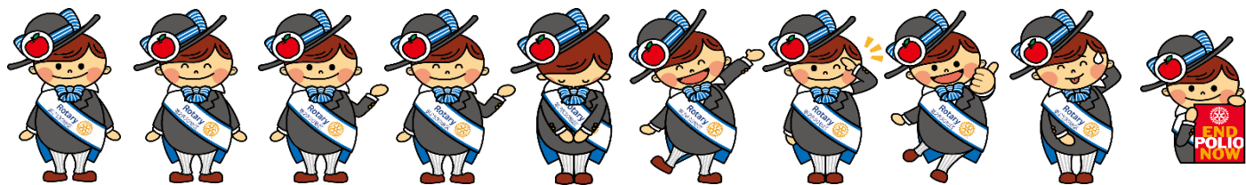
◆ ロータくんのイラスト 10種類 ◆

製作したのは、ロータくんのイラストと着ぐるみです。このうち、イラストはそれぞれポーズが違う12種類。データはPNGとGIFがあり、GIFの2種類はおじきと手上げの動きを付けました。各クラブの発出文書やウェブサイト、SNS、ノベルティ、各種広告等での活用を想定しています。既に、END POLIO NOWのロータくん版ピンバッジやデジタルサイネージ用の動画等に使用されています。各クラブにおかれましては、まずは会報や各種文書に貼り付けるところから始めてください。