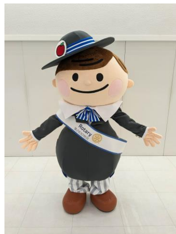
◆ ロータくんの着ぐるみ ◆